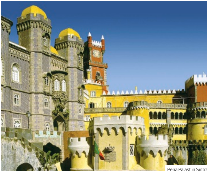
Pena Palast in Sintra