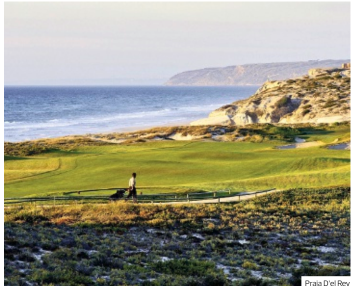
Praia d'el Rey

findet man die kleinen Holzhäuser und Villen im Streifenanzug. Auf einem langgezogenen Hügelwall gelegen, sind die Häuserfassaden fast ausschließlich im längsgestreiften Stil mit knallroter, blauer, grüner oder gelber Farbe angemalt. Obwohl es sicher schwer fällt weiterzufahren, ist das Ziel des heutigen Tages auch ein Erlebnis. Porto, die quirlige Metropole des Nordens und Zentrum des Portweinhandels am Douro, beeindruckt durch ein herrliches Stadtbild und die unter UNESCO-Denkmalenschutz stehende historische Altstadt. 2 Nächte im Hotel Tryp Porto Centro. Ca. 116 km (ca. 1,5 Std. Fahrtzeit). (F)