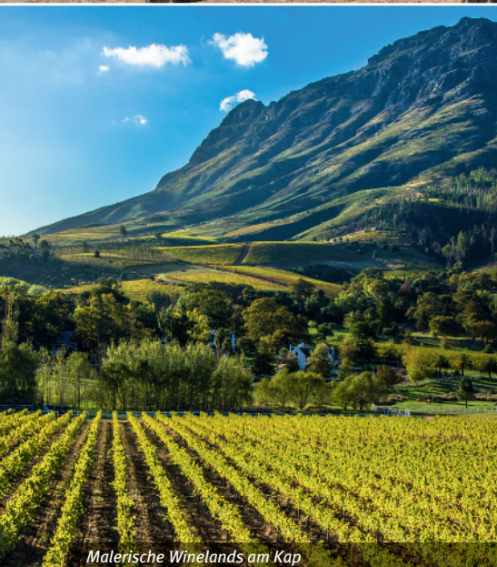
Malerische Winelands am Kap