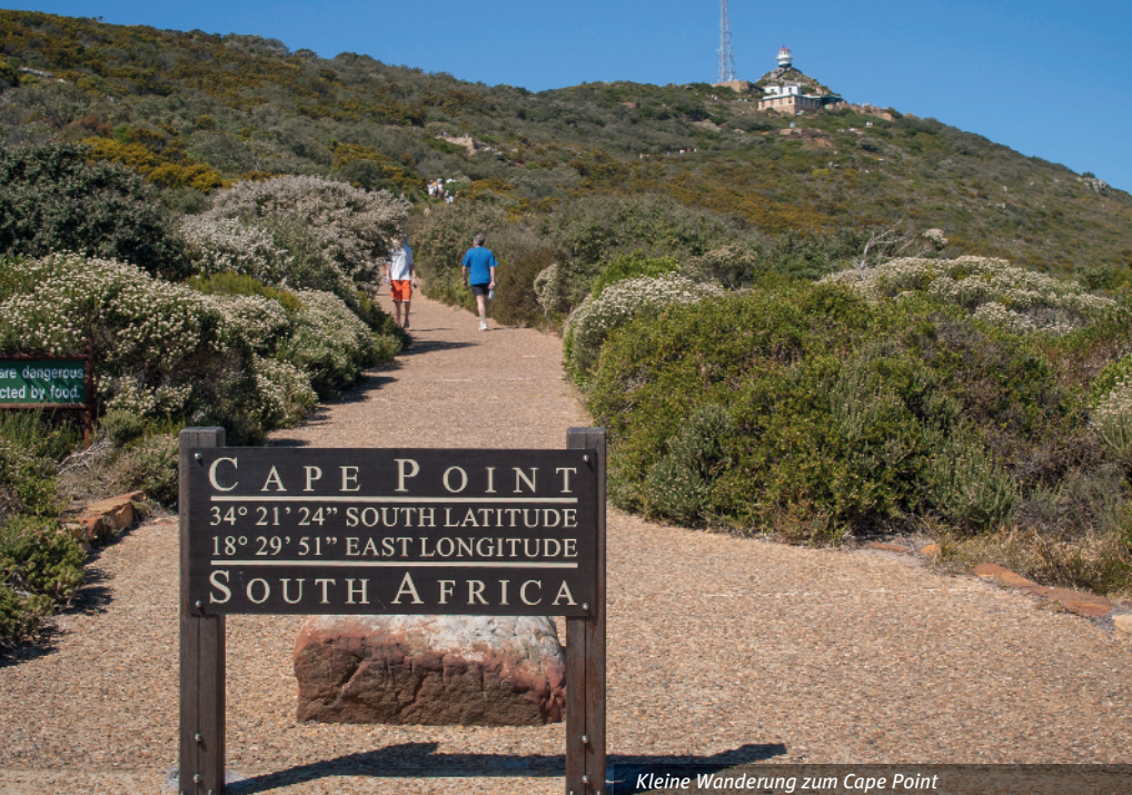
Kleine Wanderung zum Cape Point

Visum für Dubai: bei Einreise vor Ort, kostenlos Die Vereinigten Arabischen Emirate erheben eine Tourismussteuer von ca. € 5,- pro Nacht und Zimmer, die vor Ort im Hotel bezahlt werden.