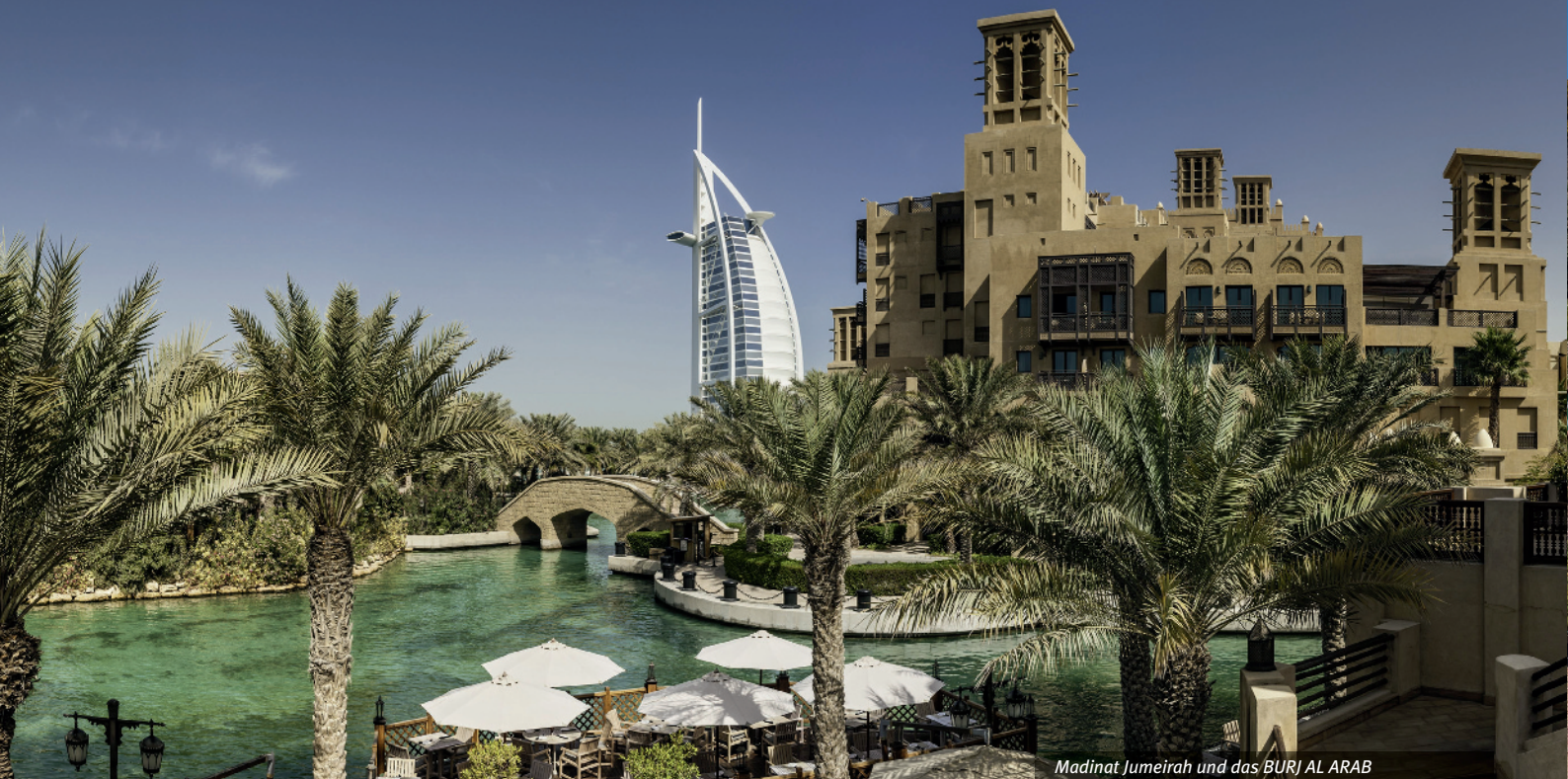
Madinat Jumeirah und das BURJ AL ARAB