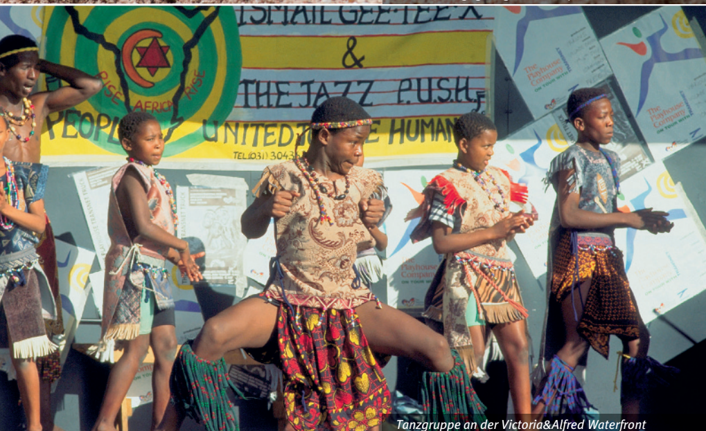
Tanzgruppe an der Victoria&Alfred Waterfront

läufern der Helderberg-Bergkette liegen viele Weingüter mit ihren weiß-getünchten Anwesen im typisch kap-holländischen Baustil. In den umliegenden fruchtbaren Tälern verschiedener Flüsse gedeihen edle Reben. Alteingesessene Winzerdynastien und junge, dynamische Winzer sorgen für eine einzigartige Geschmacksvielfalt. Hier entstehen klassische, edle und feinschmeckende Weine der Spitzenqualität, von denen wir einige heute verkosten dürfen.