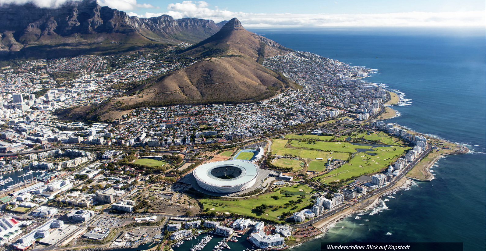
Wunderschöner Blick auf Kapstadt