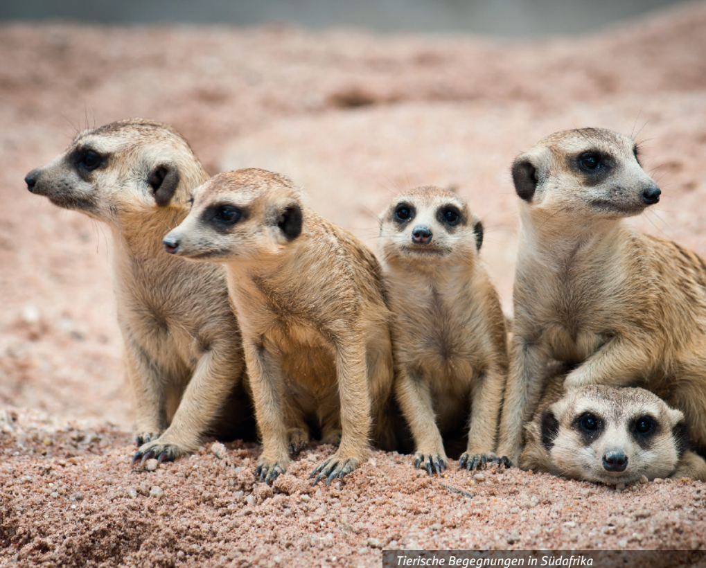
Tierische Begegnungen in Südafrika

Badeverlängerung in Mauritius: ab EUR 1.350,- im 3-Sterne-Hotel, z.B. Hotel Mariposa, ab EUR 1.650,- im 5-Sterne-Hotel, z.B. Hotel 20 Degrees South oder Hotel Shanti Maurice (inkl. Flug von Südafrika nach Mauritius, 4 Übernachtungen mit Halbpension, Transfers, Rückflug mit EUROWINGS DISCOVER nach Deutschland).