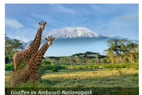
Giraffen im Amboseli-Nationalpark

Nach dem Frühstück Transfer zum Flughafen von Mombasa und Rückflug mit EUROWINGS DISCOVER nach Frankfurt.