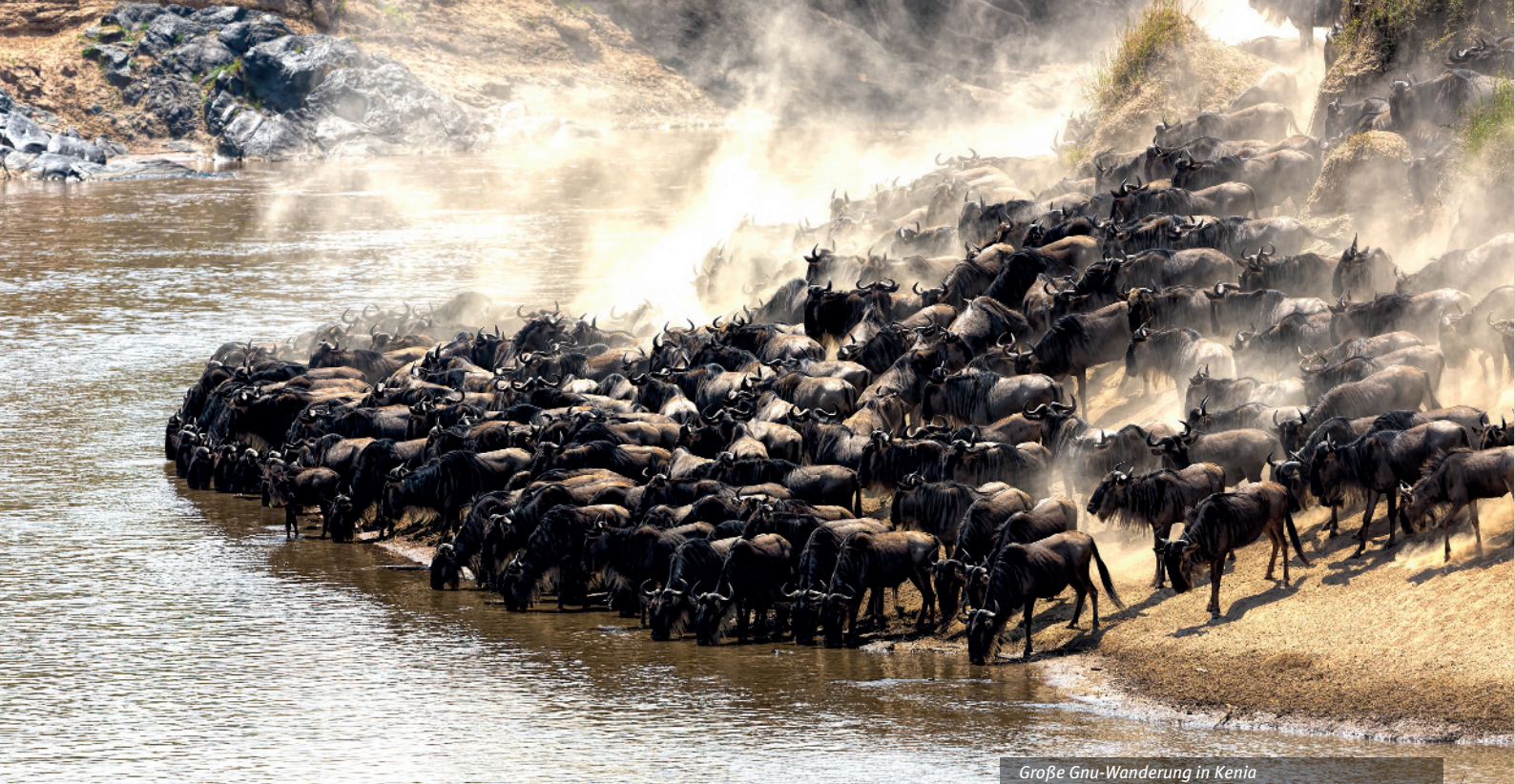
Große Gnu-Wanderung in Kenia