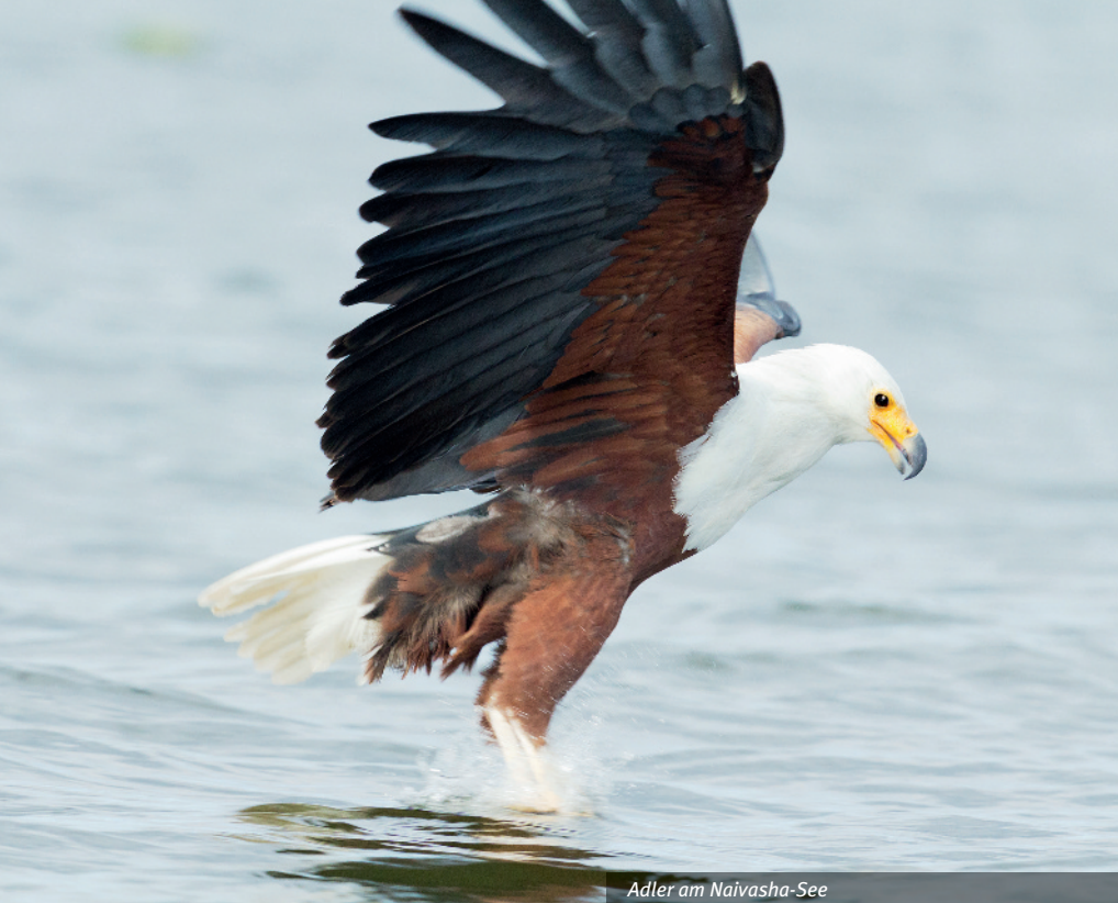
Adler am Naivasha-See