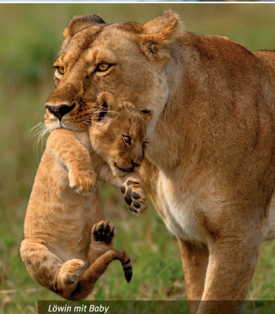
Löwin mit Baby