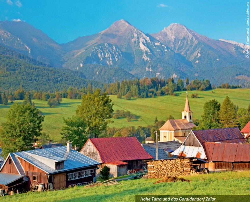
Hohe Tatra und das Goralendorf Zdiar