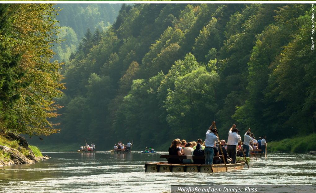
Holzflöße auf dem Dunajec-Fluss

Wachturm. Im Herzen der Stadt der Dreifaltigkeitsplatz und Kalvarienberg, eine Perle des Barock mit zwei Kirchen und 24 Kapellen, auch als Pilgerort sehr beliebt. Weiterfahrt nach Vlkolínec, unser zweites UNESCO-Weltkulturerbe am heutigen Tag, eine Bergbaugemeinde mit volkstümlicher Architektur, die wie ein „lebendiges Freilichtmuseum“ inmitten fast unberührter Natur liegt. Es geht weiter in die Hohe Tatra. Panoramafahrt durch alpine Traumlandschaften, vorbei am, auf dem höchsten Punkt gelegenen, Skiort und gleichnamigen Strbske Pleso (Tschirmer See/1346m) zu unserem Standorthotel für drei Nächte in der Hohen Tatra. 5. Tag: Zipser Land (Kezmarok - Levoca) FA Unser Tagesausflug geht heute in das Zipser Land, der an kulturellen Schätzen reichsten Region. Zunächst das Städtchen Kezmarok mit Besichtigung der evangelischen Holzkirche und ihrer ungewöhnlichen Deckenbemalung. Auch die hiesige Bibliothek ist v.a. für deutsche Gäste besonders interessant, aufgrund ihrer reichen Sammlung von deutschsprachigen Dokumenten, denn auch deutsche Kolonisatoren prägten seit dem 13. Jh. die Region (nur bei Termin -01 möglich). Weiterfahrt in den Hauptort der Region Levoca (Leutschau), mit der Stadtmauer und 250 Renaissance-Bürgerhäusern, die besterhaltene mittelalterliche Stadt der Slowakei. Besuch der St. Jakobs-Kirche mit dem höchsten