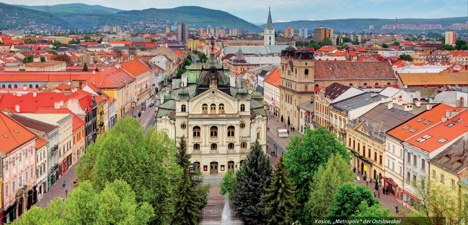
Kosice, „Metropole“ der Ostslowakei