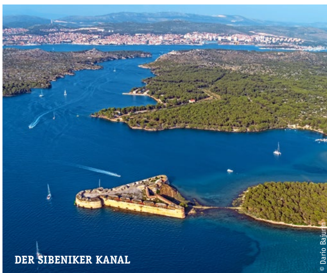
DER SIBENIKER KANAL