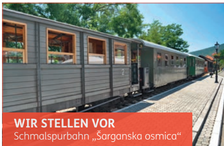
WIR STELLEN VOR Schmalspurbahn „Sarganska osmica“

Die „Sarganska osmica“ oder auch „Sargan 8“ schlängelt sich mit ihren historischen Lokomotiven auf einer Strecke von etwa 15 km durch zahlreiche Tunnel, über Brücken und Viadukte und durch malerische Landschaft. Um Steigungen von bis zu 18% zu überwinden, wurde die Strecke der Schmalspurbahn in der Form einer Acht angelegt – daher der Name.