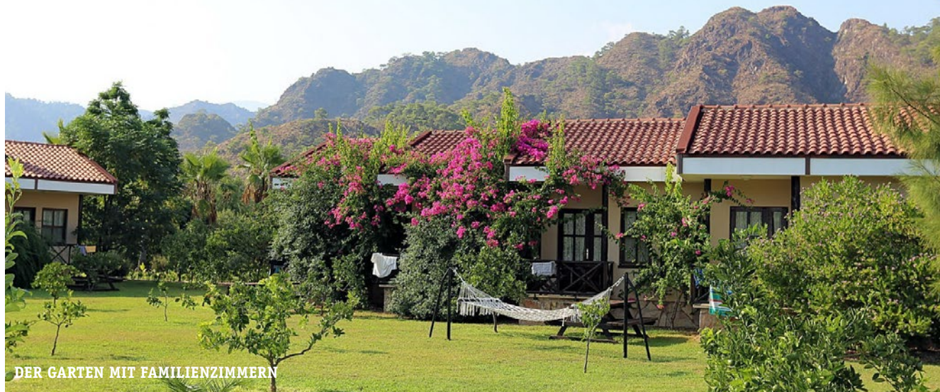
DER GARTEN MIT FAMILIENZIMMERN