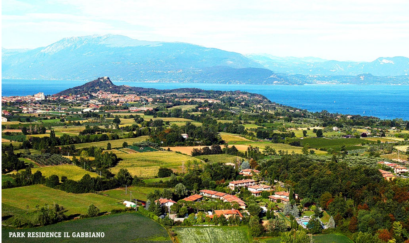
PARK RESIDENCE IL GABBIANO