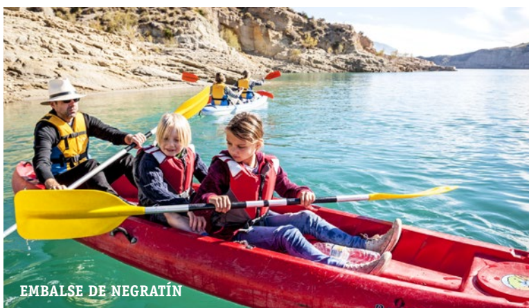
EMBALSE DE NEGRATÍN