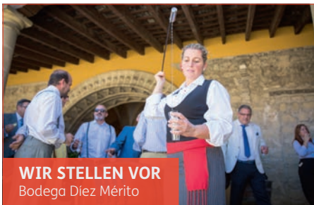
WIR STELLEN VOR Bodega Diez Mérito

Eine eher mittelgroße Bodega, die aber exzellenten Sherry produziert. Gegründet wurde die Bodega im Jahr 1876 von den zwei Brüdern Diez und Perez de Muñoz und blickt damit auf fast 250 Jahre Geschichte zurück. Streifen Sie durch die beeindruckenden Höfe und Räumlichkeiten der Bodega und lassen Sie sich von dem einzigartigen Sherry verführen!