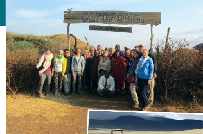
Besuch im Massai-Dorf