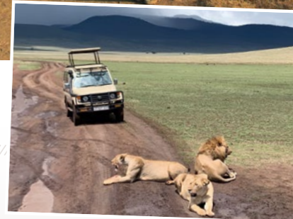
Unvergessliche Tiererlebnisse im Ngorongoro Krater