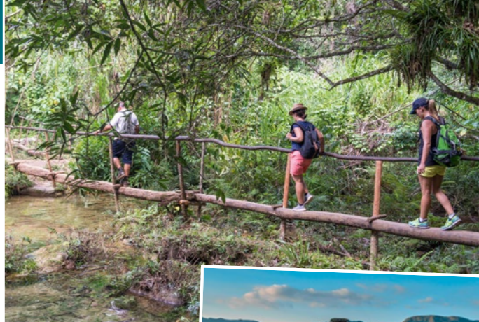
Atemberaubenden Natur in der Sierra Escambray