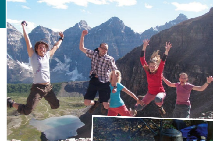
Atemberaubende Kulisse der Rocky Mountains