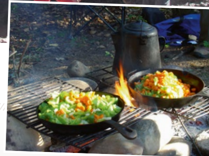
Leckere Gerichte vom Grill